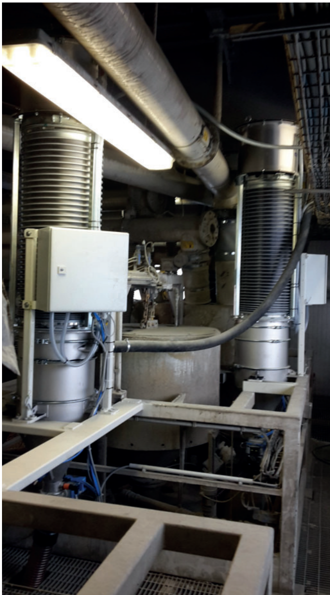
Центробежные пылеуловители над бетоносмесителями

крытых биг-бэгов теперь используются жесткие пластиковые контейнеры, которые легко закрываются и лучше герметизированы. При съеме контейнеров после опорожнения выпускное отверстие закрывается во избежание любых утечек материала.