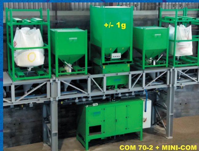
COM 70-2 + MINI-COM

info@wuerschum.com www.wuerschum.com Tel.: +49 711 448 13-0