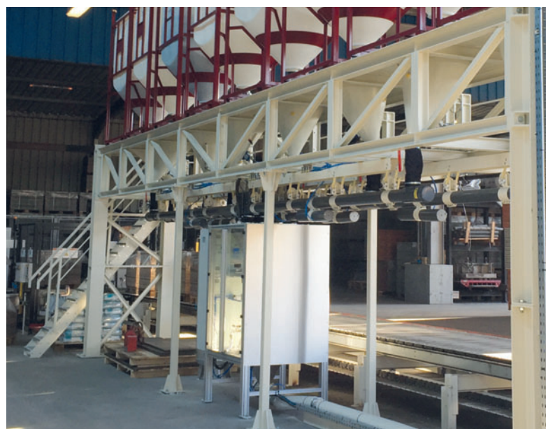
Вибропитатели и прецизионные весы COM 70-1