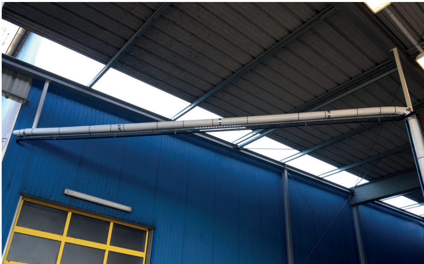
Термоизолированный шланг подачи

встроен датчик температуры, а корпус дозатора изолирован и герметизирован. Шланг подачи также теплоизолирован для предотвращения образования конденсата из-за колебаний температуры. Требования заказчика в отношении чистоты также были четко определены. Вместо от-