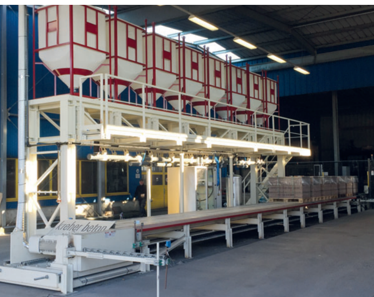
Система с 8 дозаторами пигментов с рядным размещением

Вибропитатели могут работать на трех скоростях - грубой, точной и сверхточной - обеспечивая быстрое и при этом прецизионное дозирование. Высокоточные весы блока COM 70-1 рассчитаны на взвешивание от 100 г до 30 кг пигмента с точностью до +/- 5 г. Все это осуществляется без ограничения скорости дозирования, которая составляет макс. 1 кг в секунду. Таким образом обеспечивается быстрое и точное дозирование даже больших партий. Максимальная точность +/- 5 г особенно важна для аддитивных пигментных смесей, например, чтобы выдерживать тонкие нюансы оттенков желтого цвета. Эти пастельные цвета также могут быть смешаны с оттенками красного и черного в соответствии с пожеланиями клиента. Весь процесс контролируется на предмет соответствия рецепту. Блок управления дозатора пигментов интегрирован в блок управления бетоносмесителем Dorner. Благодаря многолетнему плодотворному сотрудничеству компании Dorner и Würschum отлично работают друг с другом.