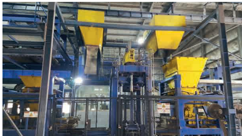
Вибропресс Masa с облицовочной смесью