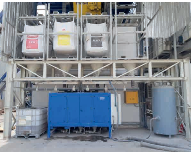
Система дозирования гранулята Com 70-3 с тремя емкостями