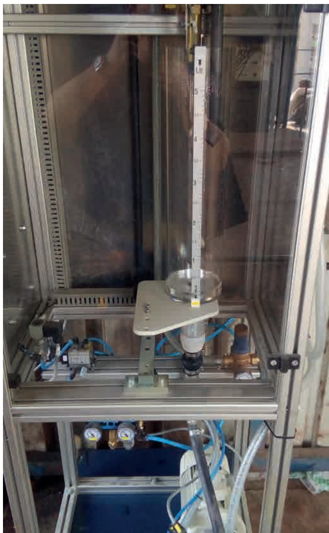
Система добавок AC 5 с насосами для выгрузки

«С гранулированными пигментами эффект перемешивания и окрашивания достигается быстрее и тщательнее, поэтому при практическом использовании можно сократить количество дозирования для достижения определенной интенсивности окраски, что позволяет производителю существенно сэкономить. Второй аспект эконо-