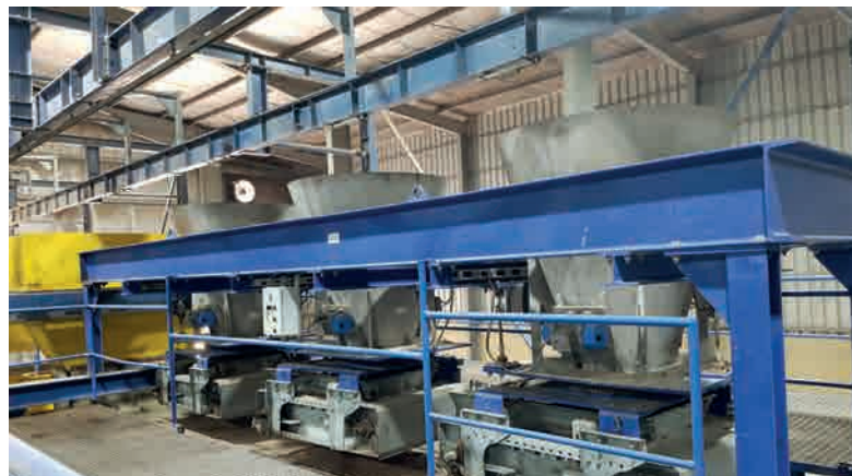
Бункеры для облицовочной бетонной смеси Multi Colour

нии со сборным ленточным транспортером с регулируемой скоростью и индивидуальным позиционированием. Это позволяет точно воспроизводить брусчатку с лицевым слоем по заданным рецептам. Чтобы быстро и надежно использовать эти функции, система дозирования рассчитана на параллельное хранение каждой из трех партий цветного бетона, требуемых согласно рецепту, на случай оперативной выгрузки. Таким образом, все три подающие емкости соединены со смесителем для облицовочного бетона. Для изготовления изделий из окрашенного опорного бетона, одна из емкостей соединена со смесителем для опорного бетона.