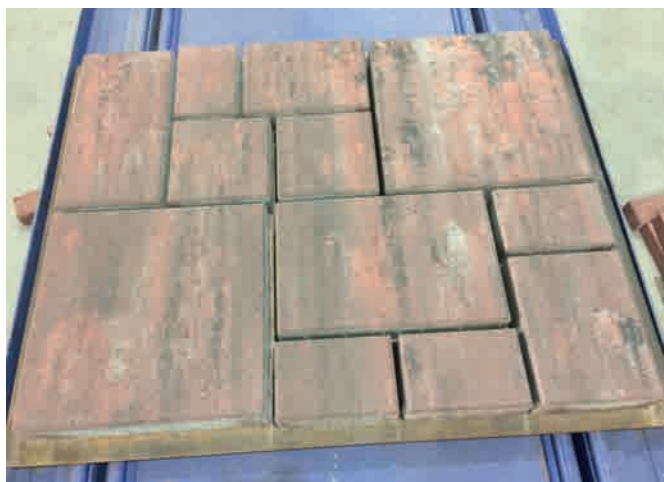
Образец с красной меланжевой окраской Multi Colour

Точность системы очень высока. Это достигается за счет вибрационных патрубков, которые приводятся в действие пневматическими вибраторами. Они могут работать на разных скоростях и с разной интенсивностью. На основе этих функций по каждому требованию и цвету можно подобрать свои настройки. Для больших партий решающее значение имеет скорость, для малых партий – точность по отношению к общему объему.